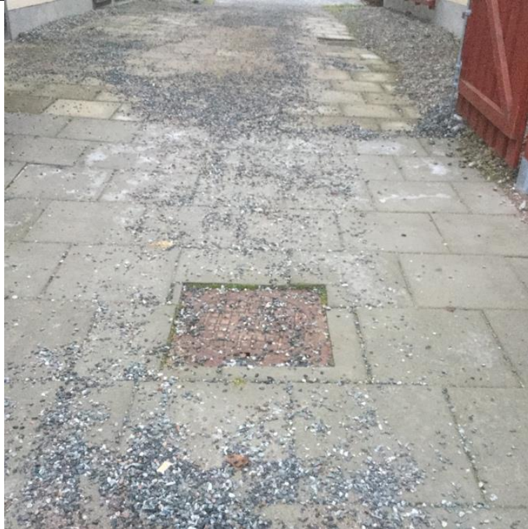
Bildnr: 1 av 1