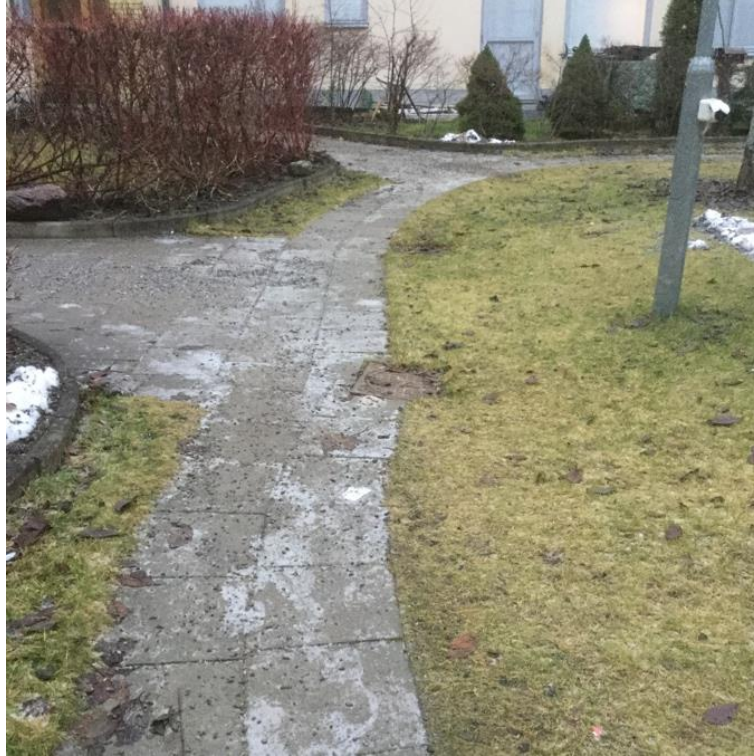
Bildnr: 1 av 1