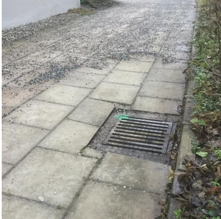
Bildnr: 1 av 1

HÄRDGJORDYTA 1 11 MAE 1 BRUNN GALLERBETÄCKNING SPRÄNG MOT BETONGPLATTOR GÅNG MELLAN JELLINGE6-8