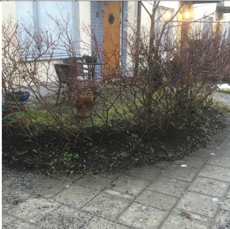
Bildnr: 1 av 1

HÄRDGJORDYTA 1 12 MAE 1 BETONG 1 KANTSTEN 1 SAKNAS MOT RABATT JELLINGE 8